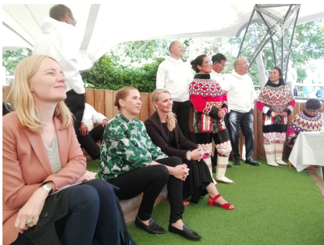
Mette Frederiksen var inviteret som taler på Nationaldagen