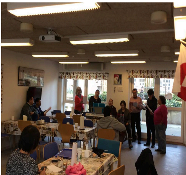
Billede taget fra fredags syng sammen.

Tamatta har i dagligdagen kreative og fritidsmæssige aktiviteter af såvel enkeltstående som fortløbende karakter. Tamatta planlægger en måned ad gangen, f.eks. har vi hver uge nyheder fra Grønland (qanoroq), fælles rengøring (støve af) og fælles sang. Vi har lavet en sangbog, som vi synger i hver fredag, vi synger også til nationaldagen og julearrangement som Det Grønlandske Hus arrangerer. Sidste år fik Tamatta to nye symaskiner til Det kreative værksted. I øjeblikket er to personer med på kursus, i at bruge de nye symaskiner. Brugerne i Tamatta lærer hvordan man laver sælskindsluffer, tasker, og andre sælskind produkter, sy perler, sy i stof og lave smykker af skrumpeplast samt hækle og strikke. Til højtiderne laver vi jule- og påskepynt og meget mere.