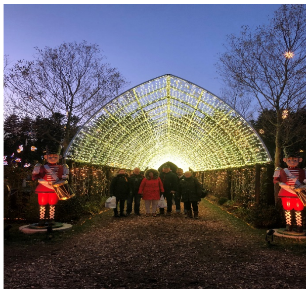
Magisk Juleshow i Blokhus

Spillerummet står altid til rådighed og der er fællesspisning hver 14. dag. Af enkeltstående aktiviteter kan nævnes spontane udflugter til Friluftsbadet, to gange i år har vi været ved Poulstrup sø for at hente gran og plukke æbler. Der har været en tur til Egholm hvor vi har plukket kvan og lavet grillmad, en dagstur til det magiske juleshow i Blokhus og lystfiskeri langs havnekajen. Tamatta havde samarbejde med Nordjysk Fødevareroverskud, som leverede overskudsmad en gang ugentligt, hvis vi ikke selv hentede madvarerne i Aalborg Øst, hvor Fødevareroverskuddet ligger. Med denne