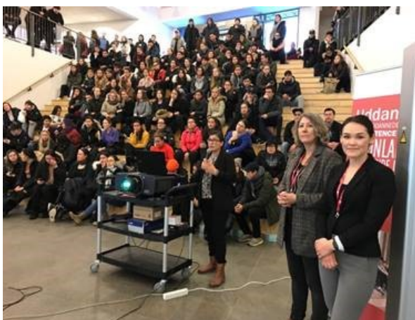
Deltagelse i uddannelseskaravanen

Vi har et fint samarbejde med Vrå Højskole, her er det ligeledes både socialfaglige problemstillinger og uddannelsesvejledning.