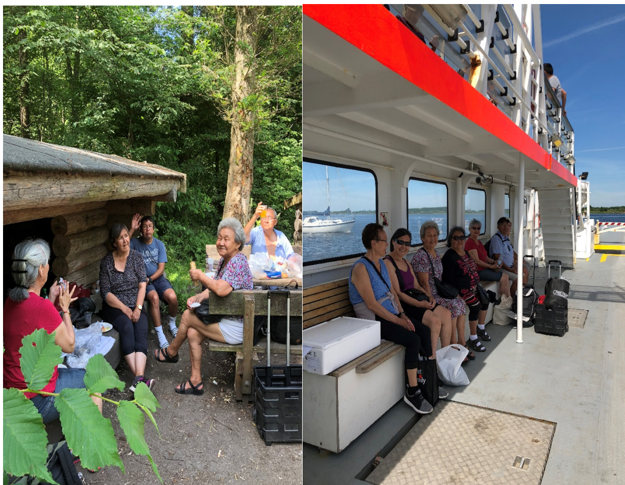
Billeder fra Egholm tur

håndsrækning kan gæsterne fremstille sund mad og via en symbolsk egenbetaling generere et lille overskud til andre aktiviteter.