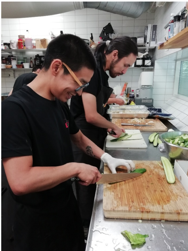
Arctic Street Food frivillige forbereder mad i køkkenet

Projektet drives gennem frivillig deltagelse af unge grønlændere med tilknytning til huset. Af kulturprojekter med deltagelse fra Arctic Street Food kan nævnes Nationaldag i Zoo, Kulturarrangement "Hele verden i Frederikshavn", Nanook koncert, Operation Dagsværk, Julehilsen til Grønland og deltagelse i Danmarksindsamlingen 2018.