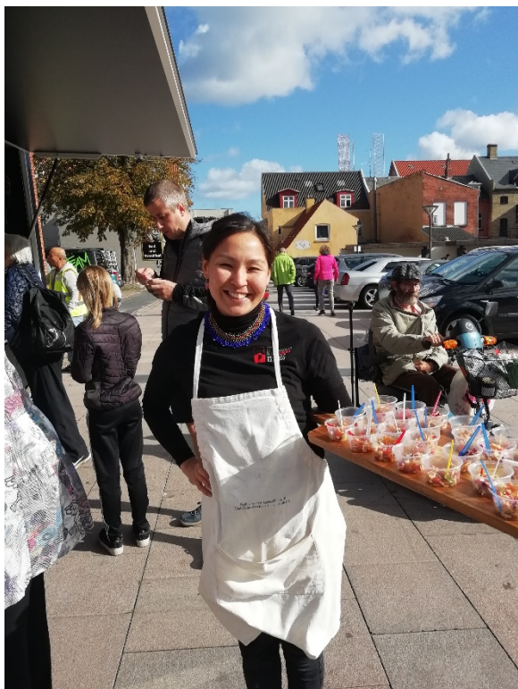
Arctic Street Food frivillig klar med en lækker servering