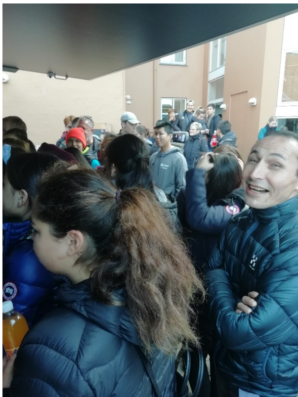
Efterskoleelever og lærere på besøg i DGH-Aalborg

Kort efter afholdt vi efterskolearrangement i Folkekirkens Hus, og i slutningen af 2018 indledtes uddannelsesvejledning om muligheder i Grønland og Danmark. Vejledningen blev tilrettelagt således, at DGH kom ud til de efterskoler med flest elever, og efterskolerne med 8 eller færre elever blev inviteret til gruppevejledning i DGH.